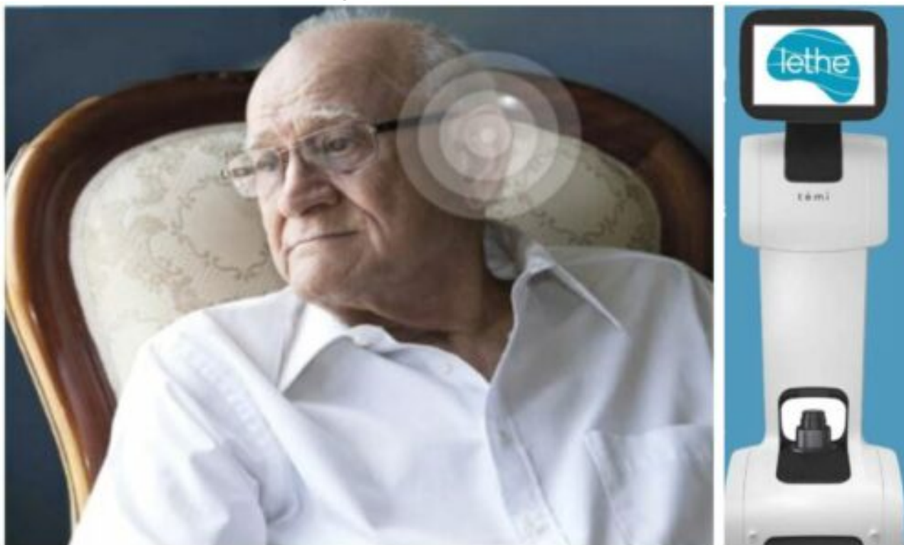
Figura 2 – Esempio di occhiali smart e Temi robot , due tecnologie utilizzate nel progetto LETHE

Il progetto prevede, nei suoi primi due anni di sviluppo, di condurre quattro progetti pilota per testare i diversi scenari di implementazione di LETHE nei centri clinici di ricerca coinvolti nel progetto. I progetti pilota saranno condotti in Austria (Università di Medicina di Vienna), Italia (Università degli Studi di Perugia), Svezia (Karolinska Institutet) e Finlandia (Finnish Institut for Health and Welfare) e coinvolgeranno persone tra i 60 e i 77 anni di età, ossia coloro considerate a rischio di disturbi cognitivi.