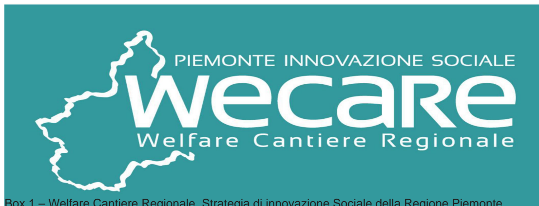
Box 1 – Welfare Cantiere Regionale. Strategia di innovazione Sociale della Regione Piemonte

All'interno di questa cornice programmatica la regione ha elaborato una strategia di intervento in ambito sociale "WECARE-Welfare Cantiere Regionale". (D.G.R. n. 22-5076 del 22 maggio 2017 – Atto di indirizzo "WECARE: Welfare Cantiere Regionale – Strategia di innovazione Sociale della Regione Piemonte" che prende spunto dalle mutate condizioni socio-economiche, nazionali e piemontesi in particolare, per proporre risposte incentrate sulla condivisione, l'innovazione sociale e interventi di tipo generativo).