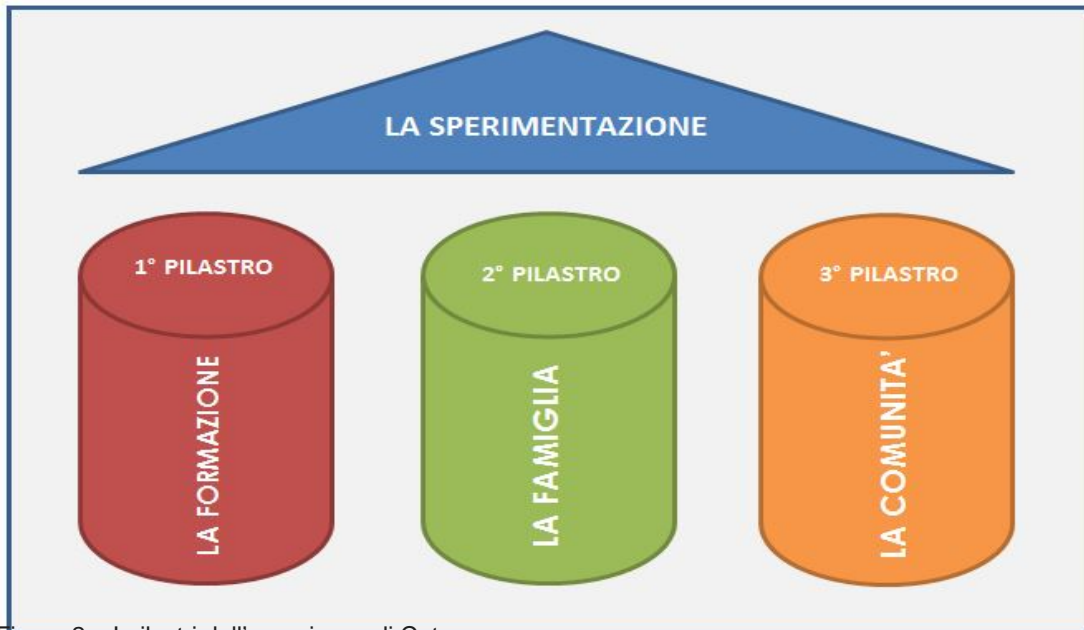
Figura 2 – I pilastri dell'esperienza di Catanzaro

La nostra azione ha cercato di proporre un orizzonte diverso attorno al concetto di "cura", dove la dimensione del lavoro tecnico, che nel tempo ha fatto prevalere l'idea del "prendere in carico" , viene integrata e forse anche sostituita dall'idea dell' "avere cura" . Il passaggio non è solo terminologico ma sostanziale. Nella nuova impostazione il protagonista è la persona, nell'incontro si valorizzano le potenzialità della relazione.