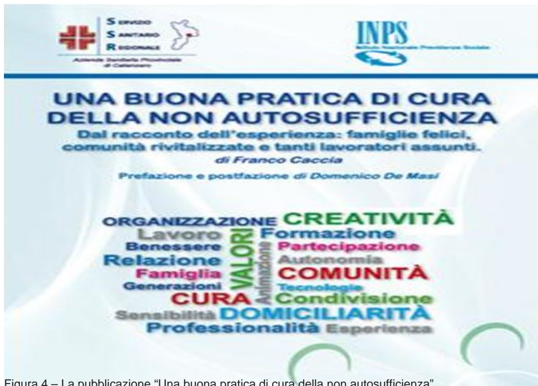
Figura 4 – La pubblicazione “Una buona pratica di cura della non autosufficienza”

Sebbene non sempre, alle buone esperienze viene data la possibilità di proseguire il loro cammino, piace pensare ad una testimonianza concreta di un welfare reso dinamico e generativo dalla freschezza delle idee che si rinnovano, alimentano e si evolvono per costruire benessere ed inclusione sociale.