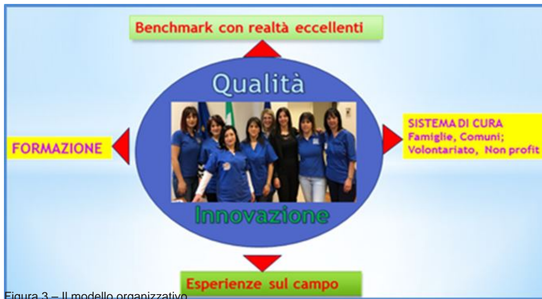
Figura 3 – Il modello organizzativo

Fra le competenze trasversali richieste a queste figure si segnalano: