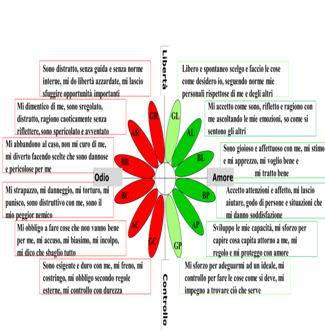
Figura 1 – Margherita degli Stati dell'IO (Scilligo P., 2009, Analisi Transazionale Sociocognitiva, Ed. LAS)

accompagnati da sigle differenti con cui vengono abbreviati gli Stati dell'Io Sé (Genitore libero GL, Adulto Libero AL, Bambino Libero BL, Bambino Protettivo BP, Adulto Protettivo AP, Genitore Protettivo GP, Genitore Critico GC, Adulto Critico AC, Bambino Critico BC, Bambino Ribelle BR, Adulto Ribelle AR, Genitore Ribelle GR).