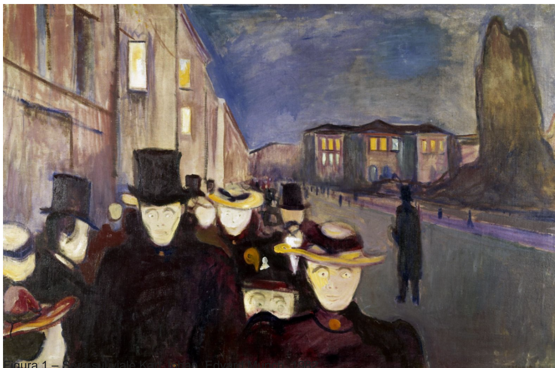
Figura 1 – Edward Hopper, Morning Sun , 1952

La solitudine che nel nostro tempo è chiamata nemica, maledetta, ci chiede uno sforzo di comprensione, di riflessione e di azione. Una solitudine che accelera in particolare il processo di fragilizzazione della persona anziana quale fattore aggiuntivo all'età, alle patologie croniche e alla perdita parziale o totale dell'autosufficienza (De Leo e Trabucchi, 2019). Una condizione che si associa ad una significativa riduzione di qualità della vita, oltre che ad una minor aspettativa, e sembra essere anche associata ad un maggior rischio di sviluppare demenza . Una solitudine che si correla alla fragilità, aggravandola, e che diviene dunque amara conseguenza oltre che 'fattore di rischio' (Cacioppo e Cacioppo, 2014; Lara, 2019).