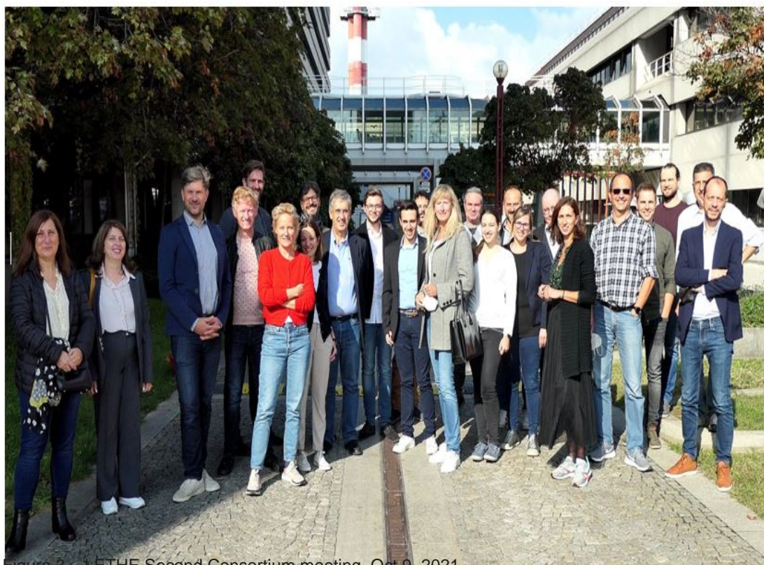
Figura 3 – LETHE Second Consortium meeting, Oct 9, 2021

Il 7 e l'8 ottobre 2021, i partner di LETHE si sono incontrati di persona, in occasione del 2° meeting di consorzio, per discutere su diversi aspetti del progetto: da come e "quanto" digitalizzare il protocollo FINGER 2.0 sul quadro tecnico, come regolare il flusso dei dati assicurandone la validità e sicurezza, quali tecnologie e parametri adottare ed inserire all'interno dei progetti pilota e come affrontare l'armonizzazione dei dati per un'analisi retrospettiva e prospettica che saranno forniti dai diversi partner clinici. L'evento è stato ospitato dalla Medizinische Universität Wien e presieduto da Sten Hanke (FH JOANNEUM), coordinatore del progetto.