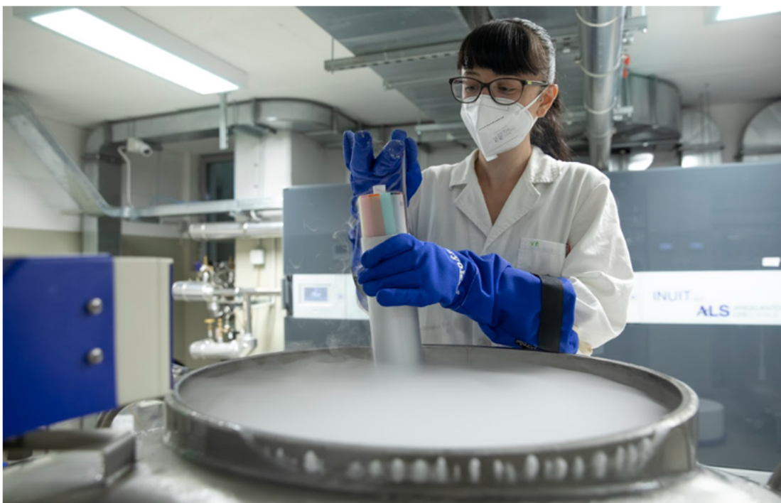
UPO Biobank, sala criogenica. Gestione dei campioni conservati in vapori di azoto