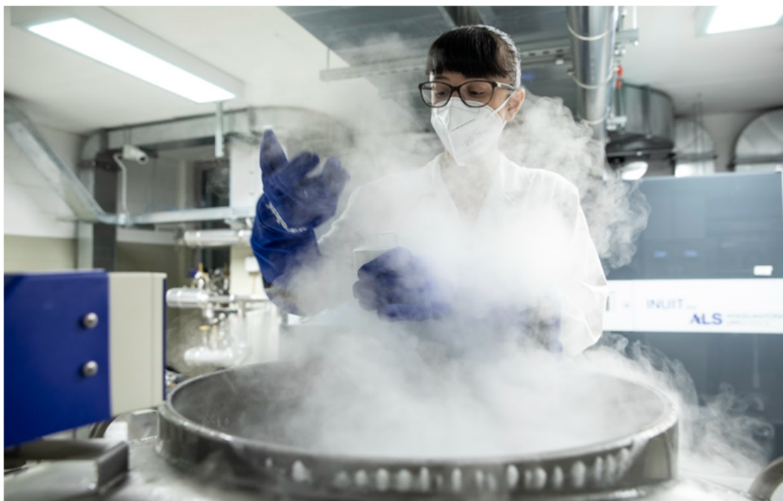
UPO Biobank, sala criogenica. Gestione dei campioni conservati in vapori di azoto