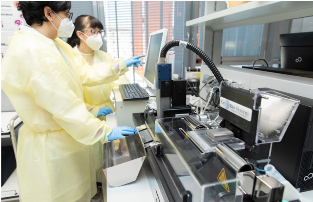
Figura 4 - UPO Biobank laboratorio di processamento. Sistema di aliquotatura semi-automatico del materiale biologico

Gli organi di governance di UPO Biobank prevedono un direttore scientifico, un comitato d'indirizzo, un comitato tecnico scientifico e un comitato degli stakeholders . Queste figure garantiscono l'imparzialità di UPO Biobank e coadiuvano le attività della biobanca, definendo le strategie e gli obiettivi a breve e a lungo termine. Inoltre, figure estremamente importanti sono il responsabile tecnico, il responsabile del sistema di gestione della qualità e il responsabile della gestione dei dati, che curano la manipolazione e la conservazione dei campioni biologici e dei dati associati, applicando le procedure operative standard e i controlli necessari a garantirne la qualità e la condivisione secondo i principi FAIR ( Findable / trovabili, Accessible / accessibili, Interoperable / interoperabili, Re-usable / riutilizzabili ), insieme alla tutela della privacy e dei diritti dei partecipanti, come sancito dal GDPR ( General Data Protection Regulation ), regolamento europeo sulla privacy in vigore dal 2018.